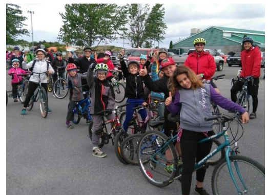
Défi Pierre Lavoie

Beaucoup de gens se sont déplacés pour supporter les quelque 7000 cyclistes qui ont traversé notre municipalité le 18 juin dernier. L'ambiance était à la fête avec de la musique, du zumba et les encouragements du public ! Merci aux bénévoles qui ont veillé au bon déroulement de l'évènement en sécurisant les rues.