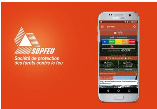
trouvez l'application sur votre téléphone intelligent.